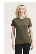
SOL'S REGENT WOMEN 01825